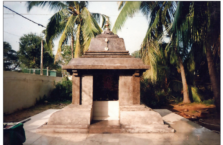
Le sanctuaire de Babaji à Katirgama

Les visiteurs aimeront séjourner à l'hôtel Sunflower tout