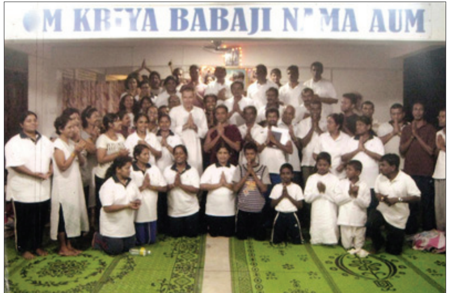
Les 60 nouveaux initiés du Kriya Yoga au séminaire le 22 octobre 2011

Nous avons le besoin urgent d'un minimum de 20 000 $ afin de racheter le terrain adjacent au nouveau hall de réunion à l'homme d'affaires qui l'a acheté en 2002. Après la