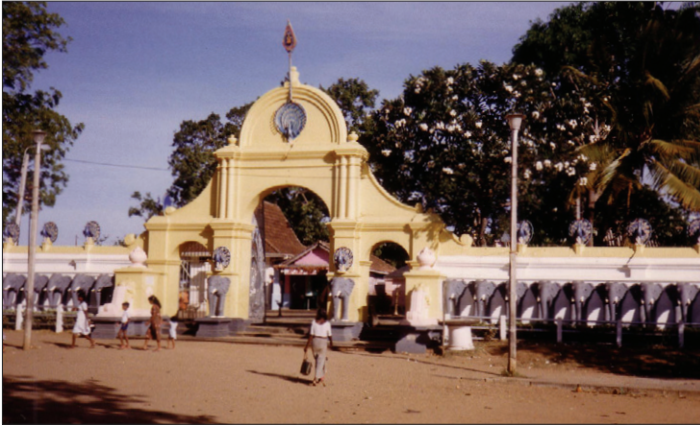
La porte d'entrée au temple de Katirgama

Le Kriya Yoga de Babaji est une synthèse du Yoga Siddhantham, l'enseignement des Siddhas. Cette synthèse a été créée par Babaji Nagaraj, avec ce qu'il a appris de son premier guru, le Siddhar Boganathar, à Katirgama, au Sri Lanka, vers l'an 215 apr. J.-C. et, plus tard, d'Agastyar, à Courtrallam, au Tamil Nadu. C'est une synthèse du yoga classique, enregistré dans les Sutras du Yoga de Patanjali, et du Tantra, enregistré dans le Tirumandiram, écrit par le Siddhar tamoul Tirumular. Ceux qui souhaitent cultiver la dévotion pour Babaji ou méditer dans l'environnement