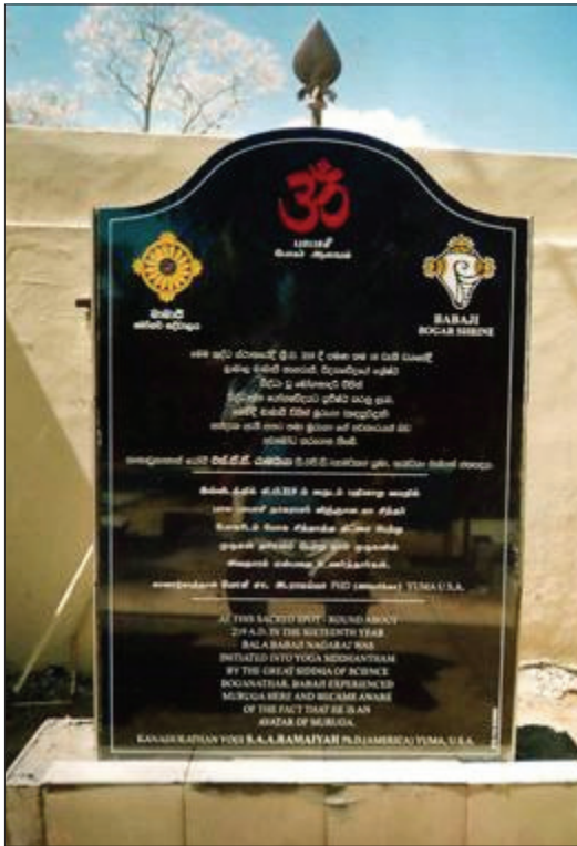
Monument qui commémore Babaji et Boganathar

Le complexe de temples de Katirgama inclut trois petits temples, côte à côte, où Ganesha, Muruga et Thevani sont adorés. La porte d'entrée est encadrée par des têtes d'éléphants sculptées, de chaque côté. À la droite du temple