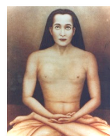
Kriya Babaji Nagaraj