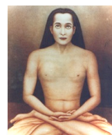
Kriya Babaji Nagaraj