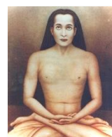
Kriya Babaji Nagaraj